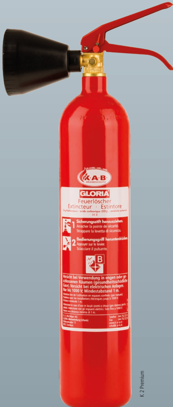
K 2 Premium

Beim Löschen Spuren hinterlassen? Nicht mit mir!